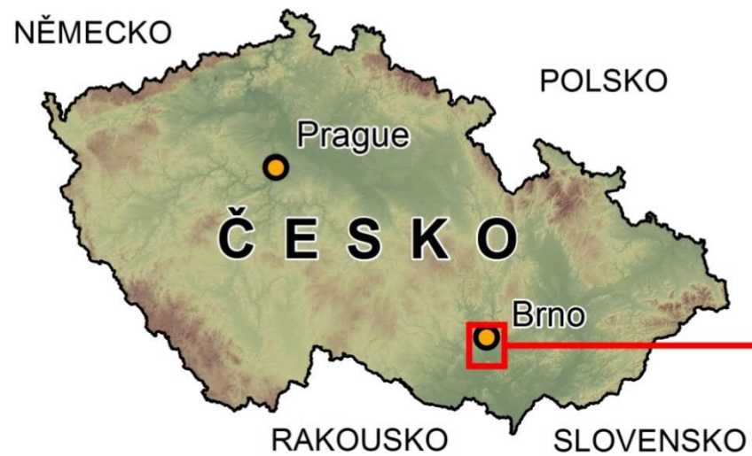
Mapa č. 25 Přehledová mapa odběrových lokalit studie.